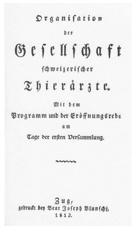
Abb. 2: Das Gründungsdokument der GST.

Mit den Veränderungen in Landwirtschaft und Gesellschaft veränderte sich auch das Aufgabenspektrum der GST. Waren es von 1901 bis 1960 in den alten Tierspitälern in Zürich und Bern im Schnitt jährlich 20 Tierärzte, die ihr Studium mit dem Staatsexamen abschlossen, stieg die Zahl der Studierenden nach Bezug der neuen Tierspitäler im Strickhof in Zürich (1963) und an der Länggasse in Bern (1965) stark an. In den vergangenen zehn Jahren wurden im