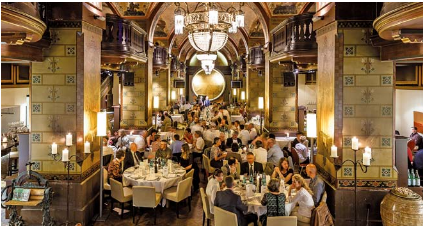
Jubiläumsdinner im Rahmen des Jubiläumskongresses „200 Jahre GST“.

Natürlich nutzte ich die Gelegenheit am ganzen Kongress und insbesondere an den berufspolitischen Veranstaltungen teilzunehmen. Den Auftakt machte eine für alle Schweizer Tierärzte offene Festsetzung mit hochrangigen Rednern aus Veterinärwesen und Politik. Ein Festabend im Berner Kornhauskeller schloss sich daran. Besonders angenehm empfand ich die freundschaftliche Atmosphäre bei den Schweizer Kolleginnen und Kollegen, in der es sehr leicht fiel, Kontakte zu knüpfen und sich auszutauschen.