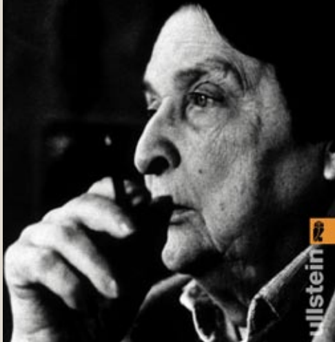
Abb. 2: Als Titel für ihre Autobiographie wählt Maria Gräfin von Maltzan die erste Zeile aus Heinrich Heines Gedicht 'Doctrin' (Ullstein Taschenbuchverlag, Berlin 1986; hier: 17. Aufl., 2005). Anlass zum Fürchten hatte sie ohne Zweifel zur Genüge.