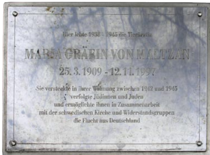
Abb. 4: Gedenktafel für Maria Gräfin von Maltzan, aufgestellt in Form eines Pulsts vor dem Anwesen Detmolderstraße 11, Berlin-Wilmersdorf, enthüllt am 12. November 1999